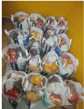
VISALAANDHRA, 7th October, 2024

దిశాశాస్త్ర-విజయవాడ అంబేద్కర్ ఇంస్టిట్యూట్ ఆఫ్ సోషల్ సైన్సెస్ (డిశాశా) అందిస్తున్న సేవలను అభినందిస్తున్నట్లు, అప్పటికే చేసిన భార్యలను సహాయం అక్కరలేక పోషించేటటువంటి రాష్ట్రవ్యాప్త విపత్, అక్షయ సేవా సంస్థలకు అందజేసింది. దీనిలో భాగంగా ఆ సంస్థ విజయవాడ అంబేద్కర్ ఇంస్టిట్యూట్ ఆఫ్ సోషల్ సైన్సెస్ లో ఆదివారం వంద సహాయక జీడించిన పిచ్చాట చేసింది. 'ఆసరా' సంస్థకు కోట్ల విలువ వస్తువులతో చేతిలో ఉన్నందువల్ల దానిని దానం చేసే నిశ్చయించారు... ముఖ్య అతిథిగా విచ్చేసిన సీనియర్ అప్పటికే జేఎంఎమ్ సుందర్శన్ శేఖర పేరుగా మున్సిపల్ కార్పొరేషన్, అక్షయ సేవలకు అందజేశారు. పిళ్ల వందల రాష్ట్ర వ్యాప్తంగా అత్యధిక సహాయ సహకారాలను అందిస్తున్న సంస్థ సభ్యులను పేరు తెలిపారు. దీనిలో భాగంగానే విజయవాడ సభ్యులందరూ వందల సభ్యులను కోల్పోయిన భార్యలకు తమ తల్లి వేరకు సాయం అందిస్తున్నట్లు చెప్పారు. ముందరికన్న సూక్ష్మమైన... ప్రత్యేక ప్రయోజనాలను సంబంధించినట్లు ఆమె ఉన్నందున భార్యలకు 'ఆసరా' అందిస్తున్న చేయూత వర్ణించలేదన్నారు. రూ. అక్షయ అర్బునా ప్రాధాన్యతలతో సాయం అందించడం ఆ సంస్థకు చెల్లించినట్లు ఆది సూక్ష్మమైనందుకనున్నారు. భవిష్యత్లో మరిన్ని సహకారాలను నిర్వహిస్తున్న ఆశాభావాన్ని వ్యక్తం చేశారు. ఈ కార్యక్రమంలో గోల్కొండ జిల్లాలోని పాల్వేలూరు.