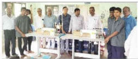
జూబ్ బ్యాగులు కుట్టే మిషన్లు లిందజేస్తున్న ఆసరా సంస్థ ప్రతినిధులు