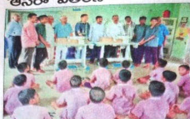
బాలుర గృహం అధికారులకు జూబ్ బ్యాగులు కుట్టే యంత్రాలు లిందిస్తున్న ఆసరా సంస్థ ప్రతినిధులు